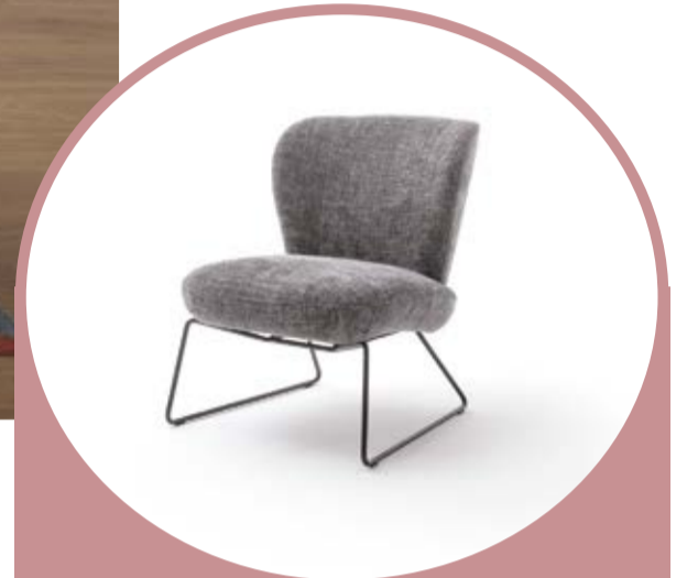
Retro-Sessel BENNI in Stoff PG 2; ca. 60 cm 529,-