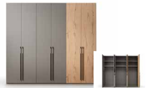
02. Drehtüreschrank pl.Velino Ausführung: Lack Laminat Visone, Absetzung in Eiche, ca. B.265,6/H.227,5/T.61