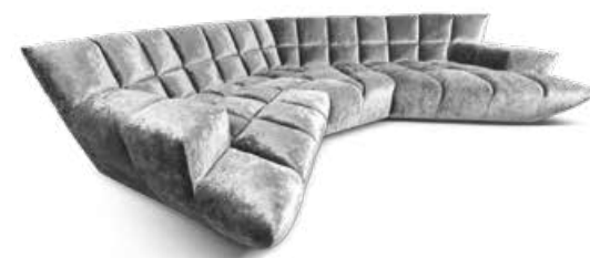
Sofa Bretz Cloud7 BxTxH 318x318x78 cm Cloud 7 ist der ultimative Bretz-Klassiker. Kassettenheftung in höchster Manufaktur-Qualität. Baukastensystem mit zwei Sitztiefen für mehr Individualität. Hoher Sitzkomfort. Kein 90° Winkel. Unkonventionelle Grundrisse