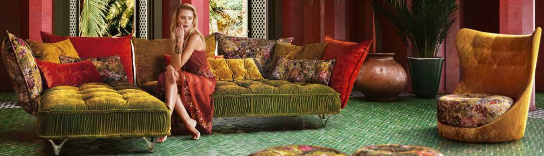
Sofa Bretz Ohlinda BxTxH 342x217x88 cm