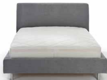
04. Polsterbett pl. Luke Das Polsterbett überzeugt durch seine gradlinig- moderne Optik und kann zu jedem Schlafzimmer individuell kombiniert werden. Größe 180x200cm, in Stoff ab 1409,-