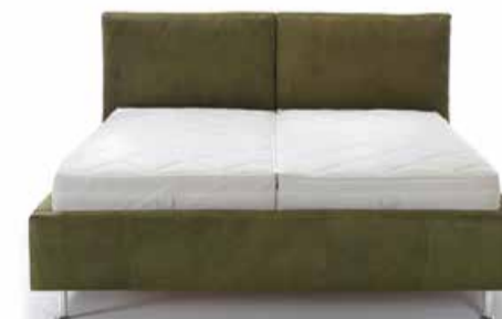
06. Polsterbett pl. Linus Dieses Polsterbett zeichnet sich durch das zweigeteilte Polsterkopfteil aus. Durch die angenehme Kopfteilhöhe und Polsterung können Sie in jeder Position entspannen. Größe 180x200cm, Preis in Leder ab 1913,-

ALLES AUSSER GEWÖHNLICH. PAUL LINDBERG SCHLAFEN