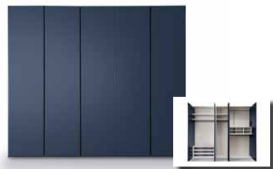
01. Drehtüreschrank pl.Velino Ausführung: Lack Laminat Blue, ca. B.247,8/ H.259,0/T.61 cm