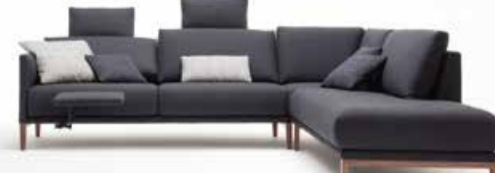
Sofa Rolf Benz Cara Mit 5 Sitz- und Sofabreiten, 10 Anreihmodellen, 2 Seitenteilhöhen, 2 Sitzhöhen, 3 Sitztiefen, 11 Fußvarianten und 2 Polsterungen kann Rolf Benz CARA jeden Wunsch erfüllen. Und mit den neuen optionalen Entspannungsfunktionen die Sehnsucht nach noch mehr Flexibilität und Komfort stillen.