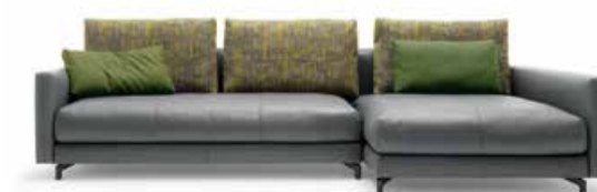
Sofa Rolf Benz Nuvola Jedes Einzelelement des modularen Programms ist sowohl gekoppelt als auch frei stehend einsetzbar. Die Sitzelemente können in verschiedenen Größen, mit und ohne Armlehne sowie mit rückenlosen Polsterbänken gewählt werden. Grundrisse lassen sich so jederzeit verändern und auflockern.