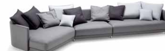
Sofa Rolf Benz Onda Praktische Modularität kombiniert mit einer neuen organisch-saften Formgebung und Individualisierungsmöglichkeiten eines klassischen Systemprogramms. Die weiche Gesamtform des Sofas bestimmen Sie ganz individuell über die Auswahl der Einzelmodelle – passend zu Ihrem Grundriss.