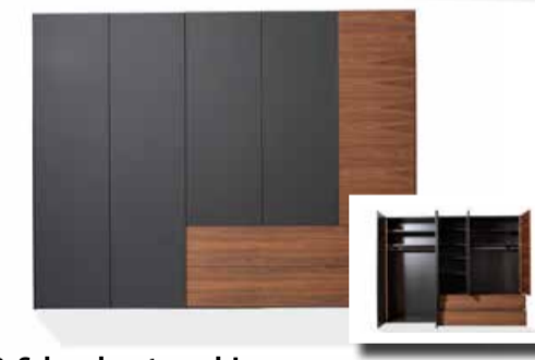
03. Schranksystem pl.Joao Das Frontdesign gibt es in vielfältigen Ausführungen wie Lack, Glas und Holz. Besonders großzügig sind die bis zu 180 cm breiten Außenschubladen.