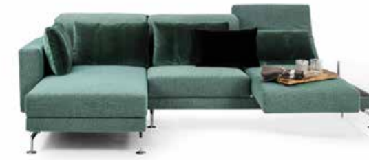
Sofa Brühl moule mit innovativen Verwandlungsfunktionen, einer legeren und modernen Ausstrahlung, Spitzenqualität sowie luxuriösem, wandelbarem Komfort. Großzügig dimensioniert bei moule-medium oder mit kompaktem Maß bei moule-small.