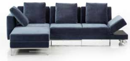
Sofa Brühl FourTwo Multifunktion für kleine Interieurs: Die architektonisch klare Ecklösung aus Longchair und Drehsofa bietet intelligente Verwandlungsoptionen und besten Komfort. Unter der Armlehne des Sofas befindet sich eine Tischablagefläche.