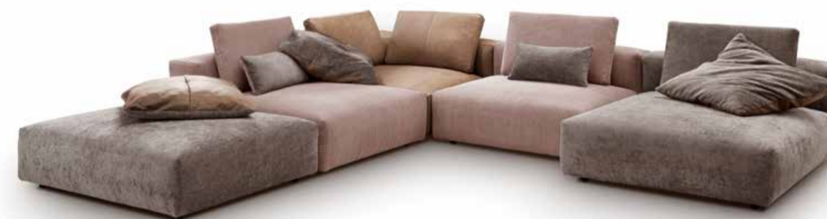
Sofalandschaft pl.Vinz Unsere neue Sofalandschaft pl.vince sieht nicht nur einladend aus, sie besitzt auch einen bequemen loungigen Sitzkomfort, der in zwei verschiedenen Sitztiefen erhältlich ist. Die Elemente können aneinandergereiht, oder einzeln aufgestellt werden, da sie alle rundherum echt bezogen sind. Es stehen viele Stoffe und Leder zur Auswahl, die nach Wunsch miteinander kombiniert werden können.

» Eine hohe Wertigkeit von Materialien und Verarbeitung ist besonders nachhaltig.