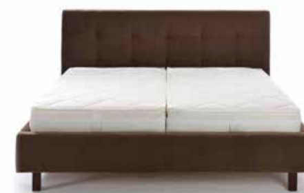
05. Polsterbett pl. Jason Die sanften Linienführungen im Kopfteil verleiht dem Polsterbett ein edles Erscheinungsbild. Es verführt Sie in einen sanften und weichen Schlaf. Größe 180x200cm, in Stoff ab 1534,-